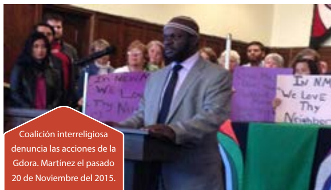
Coalición interreligiosa denuncia las acciones de la Gdora. Martínez el pasado 20 de Noviembre del 2015.

Uno de los puntos principales expuestos durante la rueda de prensa fue que los gobernadores de los distintos estados no tienen la autoridad para negar refugio en el país. Igualmente se demostró que la comunidad Nuevo Mexicana no cree en cerrar las puertas a aquellos que tratan de escapar la violencia en su país de origen. Este tipo de acción xenofóbica y anti-inmigrante/refugiados, son tácticas partidistas para crear divisiones entre comunidades y promover odio. Si quieres aprender más en que puedes hacer para mantener a nuestra comunidad unida contáctanos por teléfono ó por correo